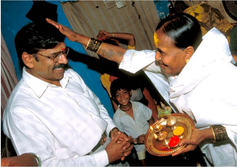
رجل في ممباي يحصل على بركة الهندوس اسمها بويبا . الصراع الديني لا زال يمثل مشكلة في الفدرالية الهندية .

إن النظام الفدرالي في الهند هو أبعد ما يكون عن الكمال. - وفي الواقع، لا يوجد هناك أي نظام فدرالي كامل. وما زالت أحداثاً مفاجئة مثل الاضطرابات الناجمة عن نظام الطبقات، وهدم أماكن العبادة، وعمليات القتل التي تستهدف جماعات إثنية معينة، والحملات الأخيرة في آسام ومهاراشترا ضد الطائفة البيهارية الناطقة باللغة الهندية تشير إلى مشاكل رئيسية لم يتمكن بعد النظام الفدرالي في الهند من حلها.